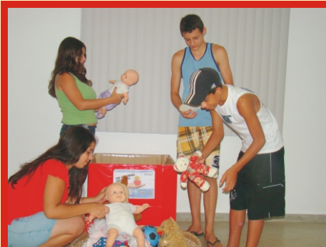
JOVENS avaliaram todos os brinquedos doados.

Com objetivo de alegrar a vida de muitas crianças, a Câmara Municipal de Alfredo Chaves e o Programa ProJovem Adolescente realizaram uma campanha de doação de brinquedos em dezembro. Com o slogan 'Doe Brinquedos, Doe Alegria', os organizadores conseguiram recolher um grande número desses que foi distribuído na semana anterior ao Natal.