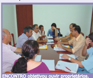
ENCONTRO objetivou ouvir proprietários.