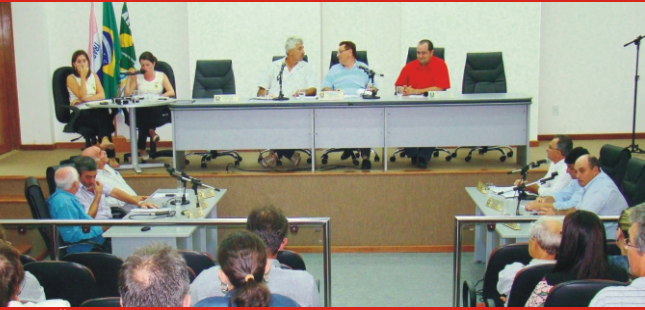
SESSÃO ordinária: discussão de projetos.

Conforme a Secretaria Municipal de Finanças, o dinheiro será aplicado na execução de diversos projetos e convênios.